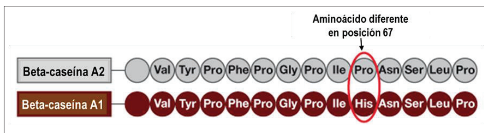
Figura 1. Diferencia en la estructura de la beta-caseína A1 y A2.