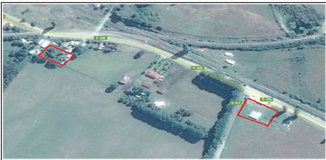
Figura 1. Ubicación específica del predio apícola, Región de Los Ríos.

Las etapas involucradas en el proceso productivo van desde la cosecha hasta la obtención del producto final. La cosecha es el primer paso del proceso, esta comienza aproximadamente a mediados de diciembre. Una vez que las alzas (cajones con marcos, donde las abejas guardan la miel) están maduras son trasladadas hacia la sala de extracción para realizar el proceso de desoperculado donde los marcos son cepillados para retirar la capa de cera que los cubre. Cuando se retira